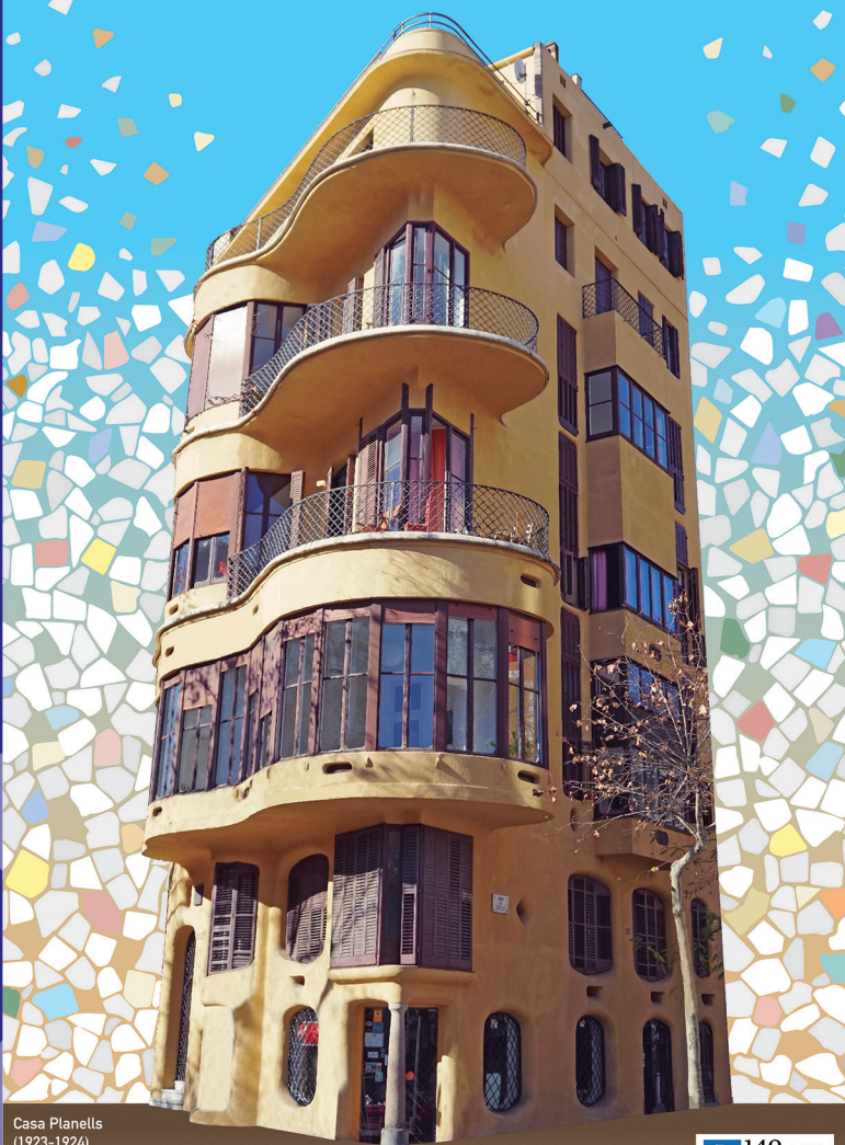
Casa Planells (1923-1924) Diagonal, 332